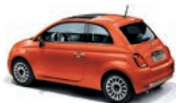
562 Spritz Orange