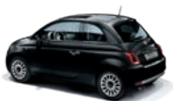
876 Vesuvio Schwarz