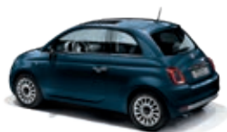
687 Dipinto di blu Blau