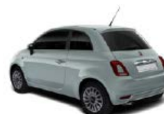
196 Rugiada Grün