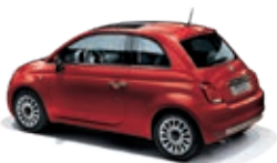
111 Passione Rot