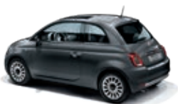
695 Pompei Grau