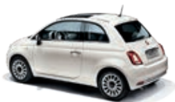
268 Gelato Weiss