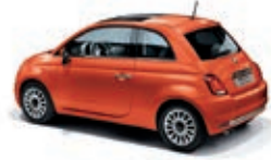
562 Spritz Orange