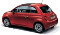
111 Passione Rot