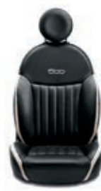
Leder Schwarz/Elfenbein 686/687