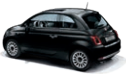
876 Vesuvio Schwarz