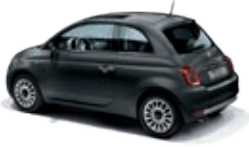
735 Carrara Grau