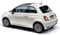
268 Gelato Weiss