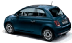
687 Dipinto di blu Blau