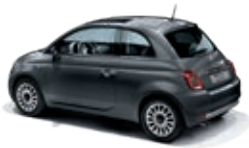
695 Pompei Grau